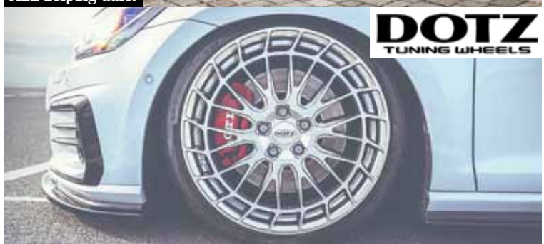
DOTZ Sepang blaze