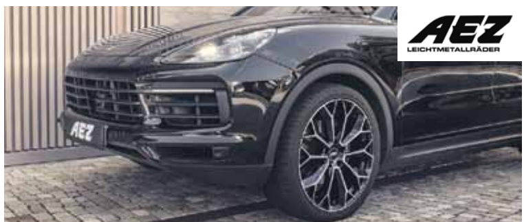
AEZ Leipzig dark

Alcar Bohemia svým zákazníkům opět zvýhodňuje nákup prémiových značek litých kol AEZ a DOTZ. Stačí si společně s koly objednat také bezpečnostní šrouby či matice Sicuplus. Ty dostanete od ALCARu jako dárek zdarma. Akce platí od 1. 3. do 30. 6. 2021 a motoristé ji tak mohou využít během celé jarní sezony přezouvání.