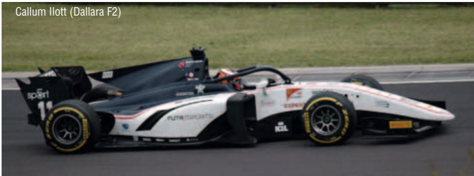
Callum Ilott (Dallara F2)