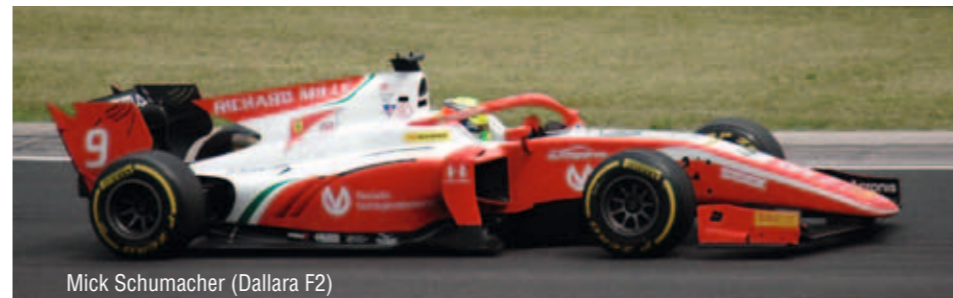
Mick Schumacher (Dallara F2)